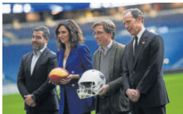
Ayuso y Almeida con el director de la NFL en España (i) y el director de Relaciones Institucionales del Real Madrid (d).

El Santiago Bernabéu volverá a acoger este año un partido de la NFL, la liga nacional de fútbol americano. La propia competición lo hizo oficial ayer a través de un comunicado en el que dijeron estar «encantados» con su regreso a España. La NFL ha llegado a un acuerdo multianual con el Ayuntamiento, la Comunidad y el Real Madrid, por lo que contempla, además, la llegada de un nuevo encuentro en 2027, estableciendo a la capital como base exclusiva de la NFL en el país durante ese periodo.