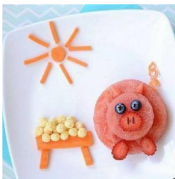
A LOS CERDITOS LES GUSTAN LOS CERALES

Con dos círculos de sandía, uno más grande y otro más pequeño, hacemos el cuerpo del cerdito. El morro será una rodaja de fresa y dos rodajas más pequeñas las patitas. Los ojos pueden ser dos arándanos y el rabito una tira de zanahoria. Con la zanahoria haremos el comedero y el sol. Y para que el cerdito se haga muy mayor, le pondremos bolitas de cereales. ¡A comerse todo!